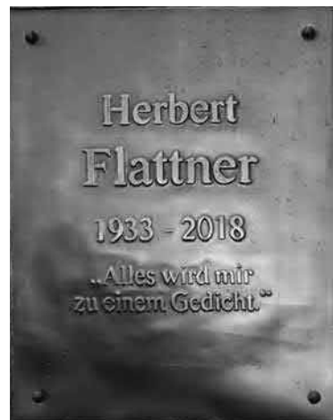
Gedenktafel am Kärntner Dichterweg in Zammelsberg