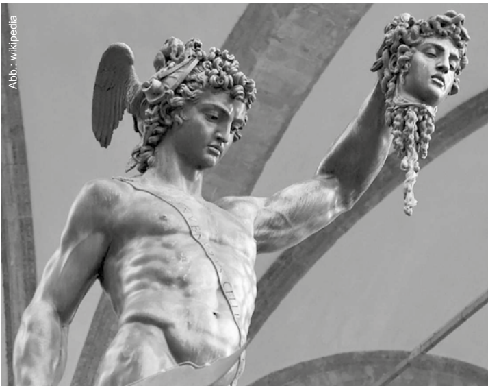
Benvenuto Cellini: Perseus mit dem Haupt der Medusa (Ausschnitt)

Alles beruhte schließlich einzig allein auf dieser Ordnung und auf der Gewissheit, dass der Tote schwieg. Dass wieder ein Mensch schwieg, schwieg als ein toter Rebell. Dass er endlich auch schwieg über die andere Ordnung, jene andere , für die er starb, weil er für sie zuvor gelebt hatte. Dieses Schweigen aber hörte mit einem Male die gesamte Welt und lauschte! Lauschte dem unwiderstehlichen Schweigen des Toten, blickte auf sein Grab – und erkannte! – Erkannte plötzlich den Toten ganz genau: sein Wollen, seine Tat und sein Opfer – denn stets überlebt eine Idee ihre Galgen!