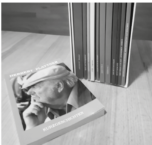
Flattners Gesammelte Werke

Die 13 Bücher sind nach Literaturgattungen und Themen geordnet: Zur Einleitung / Liedtexte Mundart / Liedtexte Hochdeutsch / Lyrik – ungereimt / Gedichte 1 / Gedichte 2 / Gedichte in Mundart / Spott- und Streitgedichte / Spottgedichte / Das Spottbüchlein / Kurzgeschichten / Vier Zeilen zur Zeit, Aphorismen, Haikus / Enthüllungen, Gleichnisse, Märchenhaftes und Märchen.