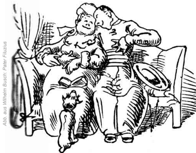
Abb. aus Wilhelm Busch: Peter Filizius