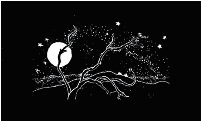
Trude Waehner: Vierter Tag – aus dem Zyklus Schöpfung und Vernichtung (Die Genesis)

Trude Waehners Holzschnitt „Vierter Tag“ aus dem Zyklus „Schöpfung und Vernichtung (Die Genesis)“ (um 1970) auf dem Umschlagtitel hätte Eichner vermutlich gefallen.