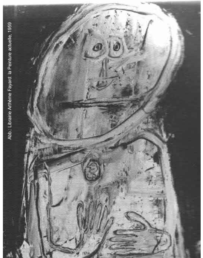
Abb.: Librairie Arthème Fayard: la Peinture actuelle, 1959

Meine Ausgangsthese lautete: Damit in einer Demokratie das Tragende, die Fundamente, nicht den jeweiligen Mehrheitsverhältnissen zur Disposition stehen, muss es einen tragfähigen Konsens über die „Grundwerte“ geben, über das „Wahre, Gute und Schöne“. Es wurde der