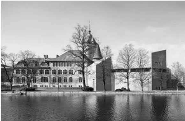
Das National- im Landesmuseum Zürich

sene „Rechtecklöcher“. (Stolz ist man im Übrigen auf die Statik, ebenso wie die Minergie-Zertifizierung, den höchsten anerkannten Standard für Niedrigenergiebauweise in der Schweiz.) Fazit: Trotz zweifacher Annabelung an den Altbau scheuen Höhe- und Breitenausdehnung die Monumentalität eines kristallin gebrochenen Eigenkörpers nicht.