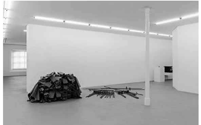
Ausstellungsraum im Kunstmuseum Basel

Decke und ein Klebeparkett, im Hellbraun als Kontrast kaum gewollt stark an Wohnräume erinnernd. Weniger ist mehr? Nein, die wohl in ihrer Sparsamkeit als eindrucksvoll bewertete Materialwahl erzeugt bei allem Willen zu einer variierten Uniformität dennoch eine Art von Unordnung, die die Ruhe der rechtwinkligen Flächen konterkariert. Oder umgekehrt: Es