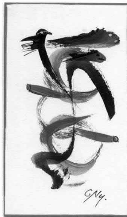
C-Ny-Mini 40: Fisch oder Vogel