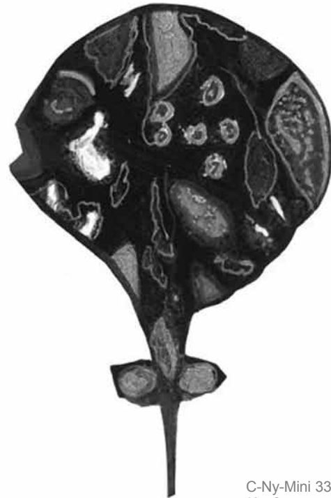
C-Ny-Mini 33: Kopf

Lassen Sie sich zu dieser Form des würdevollen Ansprechens verführen – Smileys per Handy oder Laptop versenden kann schließlich jeder Analphabet! Und Christine Nyirády sei herzlich gedankt für Ihren Einsatz gegen die sich immer stärker verbreitende Banalität!