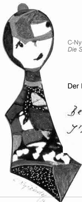
C-Ny-Mini 27: Die Schüchterne

Mit ihren C-Ny-Minis (sprich: „SINI-MINIS“) verfolgt die Künstlerin ein gerade jetzt (es sei an den Hinweis im letzten Leitartikel erinnert: Finnlands Schüler lernen keine Handschrift mehr ) leider hochaktuelles und sehr hochtrabendes Ziel: Sie will an das Kulturgut Handschrift erinnern und dazu verleiten, wieder ein bewusstes, persönliches Zeichen von Individualität und Wertschätzung des Adressaten zu setzen, wenigstens bei „guten Gelegenheiten“.