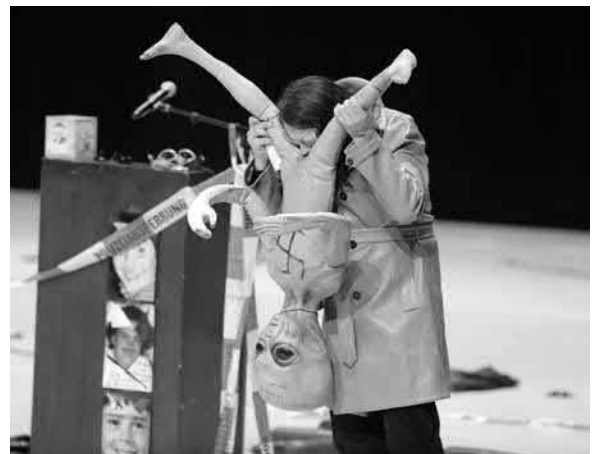
Jonathan Meese: Oralsex mit Puppe

Denken wir an Jonathan Meeses Aktion „Oraler Sex mit Puppe“. Durch dieses Tun wird hochemotional die Querverbindung zur Sexualität dargestellt, denn Kunst sollte doch ein wenig schmutzig sein, um das Prädikat „absolut geil“, „zeitgemäß“ und „neu“ zu verdienen.