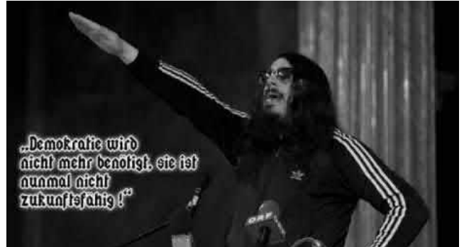
Jonathan Meese in provokanter Pose

Die Situation ist derart dramatisch, dass sogar einer der bekanntesten zeitgenössischen Künstler zum Hitlergruß greifen musste, um in den Medien „die ihm zustehende“ Aufmerksamkeit zu erhalten. Der Aufschrei, den er damit provozierte, war ein voller Erfolg. Denn davor war es ein wenig zu still geworden um ihn, den großen Meister mit dem