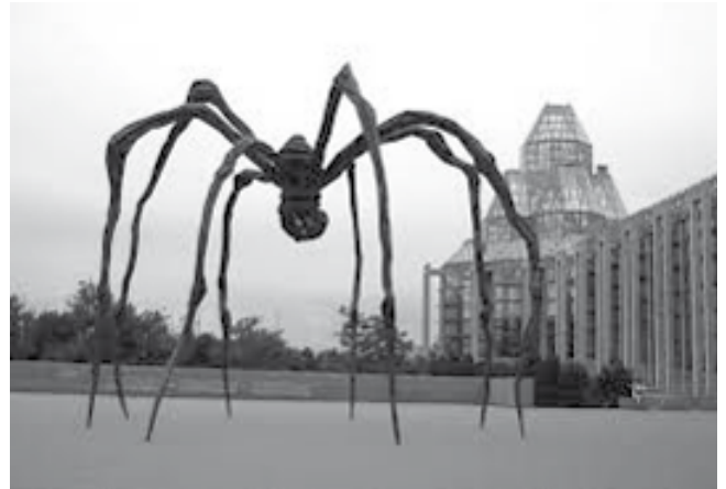
Louise Bourgeois: Maman Die größte Skulptur (9,27 × 8,92 × 10,24 m, 8165 kg) aus der Spinnen-Serie der Künstlerin soll eine „Hommage“ an ihre Mutter sein. Deren Reaktion ist leider nicht bekannt ...