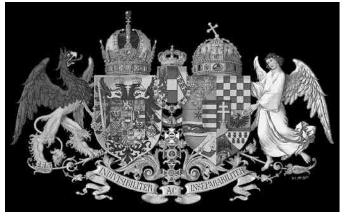
Das mittlere gemeinsame Wappen von Österreich-Ungarn (1915-1918)

Faktum ist, dass in der k.u.k.-Monarchie die Maria-Theresianische Bildungsethik – das Bürgertum sollte bildungs- und