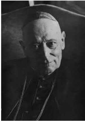
Kardinal Joseph Mindszenty (1892 – 1975)

in dem Gedichtband Das verhüllte Kreuz , in dem er erstmals publiziert wurde, den Titel Begegnung, abseits (mit Kardinal Mindszenty im Pazmaneum, Wien, dem letzten Zufluchtsort) . Der Titel wie auch das erste Gedicht weisen auf Fakten hin, die die Isoliertheit, Einsamkeit des Priesters deutlich machen, der ohne Pracht, Anerkennung und Macht nur noch erduldet wird. Das lyrische Ich akzeptiert diese Haltung nicht: