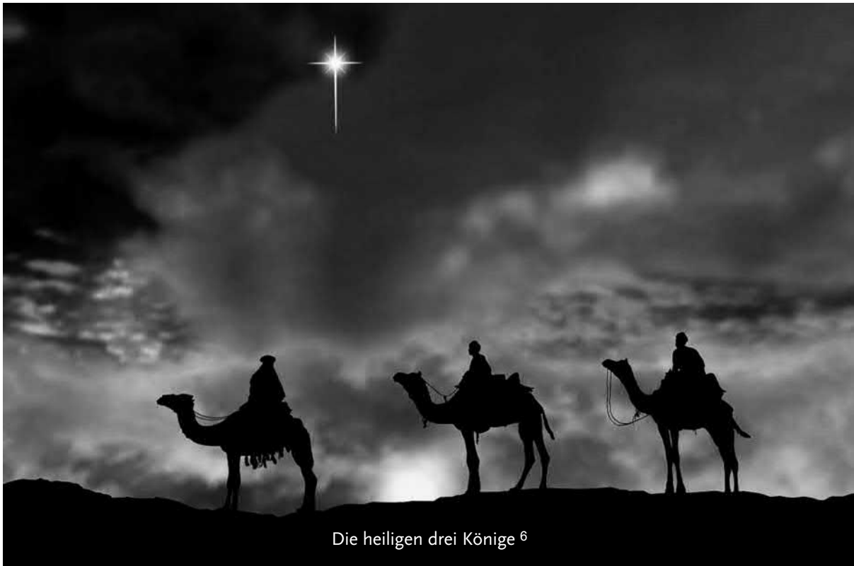
Die heiligen drei Könige 6

Wir, für die, die nicht da sind, danken für seine Geduld.