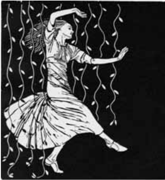
Erwin Lang: Grete Wiesenthal – Donauwalzer aus: Oscar Bie, FN4

dekoriert, bald zu einem geistigen und gesellschaftlichen Zentrum Wiens wurde.