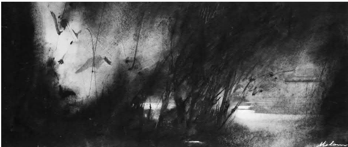
Eva Meloun: Abend am Bach , Mischtechnik