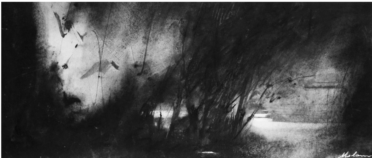
Eva Meloun: Abend am Bach , Mischtechnik