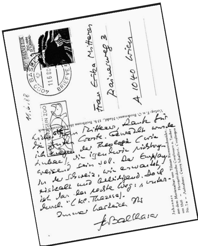
Letzte Karte Balthasars an Erika Mitterer