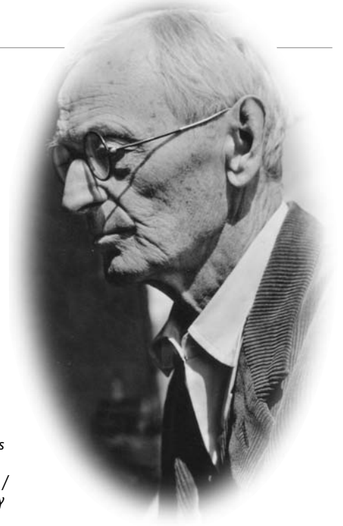
Hermann Hesse, Montagnola 1955