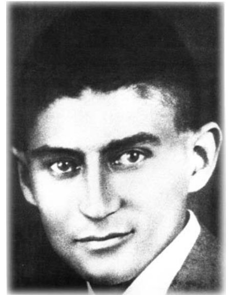
Franz Kafka, 1917

Die folgenden Beiträge heutiger Literaturkenner zeigen, dass Kafka nichts von seiner Faszination eingebüßt hat.