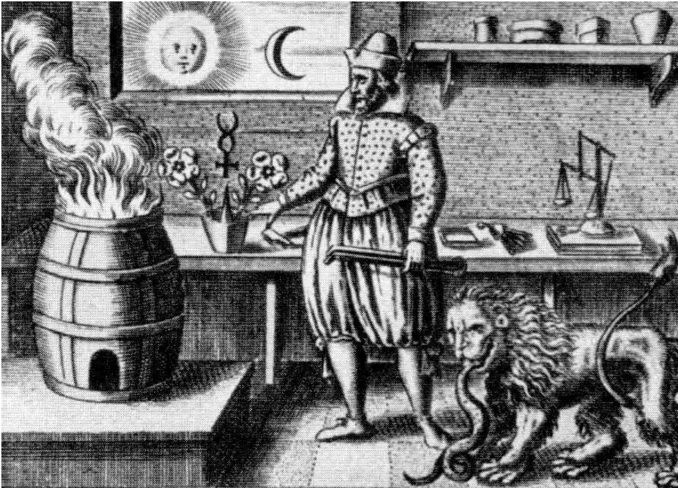
Abb. aus Goldmachen – Wahre alchymistische Begebenheiten, hg. von Alexander v. Bernus, Verlag Eugen Salzer, Heilbronn 1936

Weiterführung der Erzählung bestätigt das, denn er kann nur langsam und durch große Leiden zur Einsicht in diese geheimnisvolle Wahrheit geführt werden.