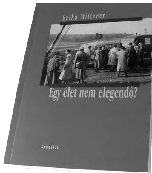
Die ungarische Ausgabe von Tauschzentrale : Ein Leben ist genug?

Schon in den Tagen der Revolution reifte in ihr – dem Tagebuch zufolge – der Entschluss, ein großes „Freiheitsdrama“ zu schreiben – oder sogar eine „Griechische Tragödie“, in der das Radio der modernen Zeit entsprechend die Rolle des Chores zu übernehmen