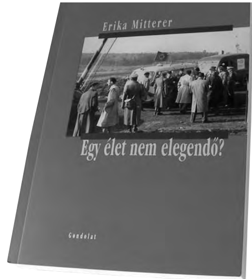
Die ungarische Ausgabe von Tauschzentrale : Ein Leben ist genug?

Schon in den Tagen der Revolution reifte in ihr – dem Tagebuch zufolge – der Entschluss, ein großes „Freiheitsdrama“ zu schreiben – oder sogar eine „Griechische Tragödie“, in der das Radio der modernen Zeit entsprechend die Rolle des Chores zu übernehmen